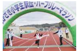
笑顔でゴール！(小学生駅伝)